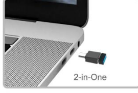
2 Type-C Adaptor

USB-A'dan, Type-C'ye dönüştürücü ile 2.4G alıcı Type-C portuna da takılabilir.