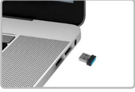
1 USB Receiver